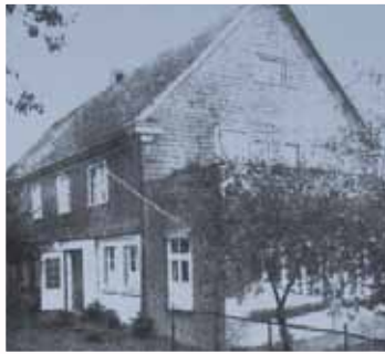
Vierlinden früher und heute Wohnhaus aus dem ehemaligen Biobad in Wallefeld