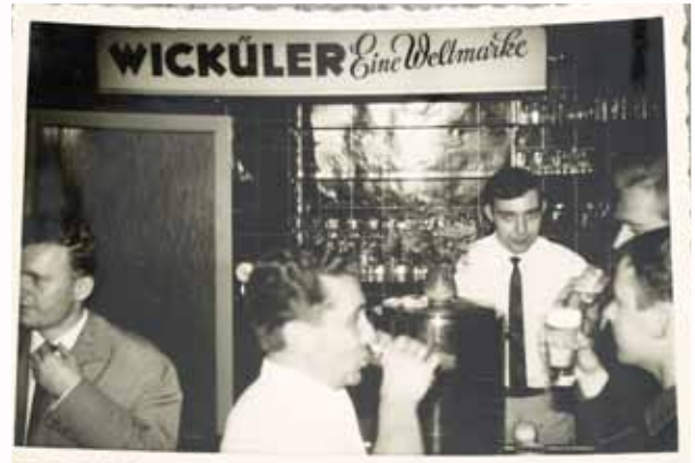
Knusperhäuschen innen und heute

Das Knusperhäuschen, Inhaber Heinz Erkenz, ist verkauft und heute ein Wohnhaus.